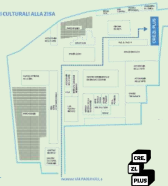
CANTIERI CULTURALI ALLA ZISA

Le attività si svolgeranno presso Cre.Zi. Plus Cantieri - Culturali alla Zisa;